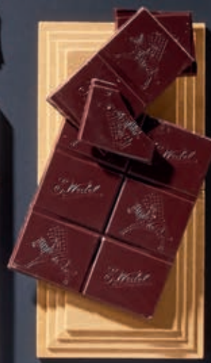
CZEKOLADA WEDEL Z CZĄSTKAMI OWOCÓW