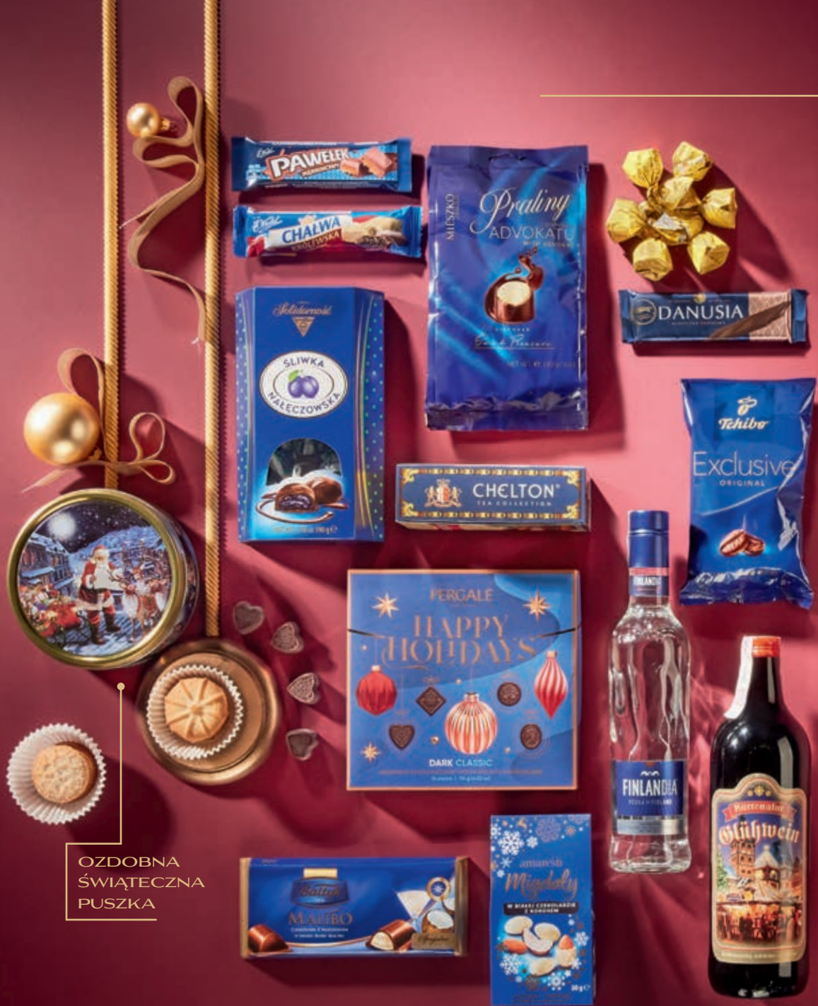
OZDOBNA ŚWIĄTECZNA PUSZKA