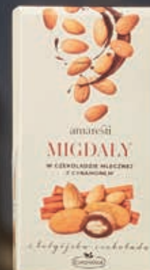
MIGDAŁY Z BELGIJSKĄ CZEKOLADĄ