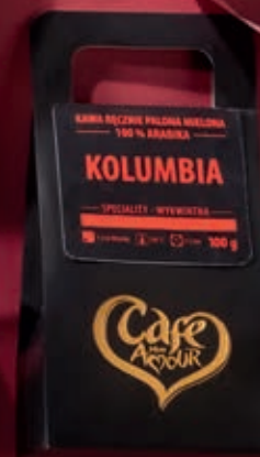
RĘCZNIE PALONA KAWA