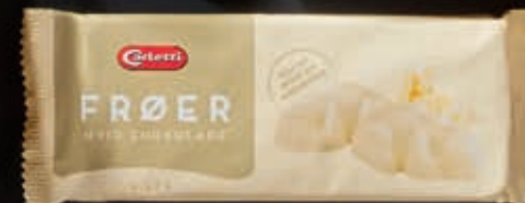
Z DELIKATNYM WINNYM POSMAKIEM