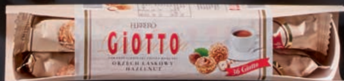
ELEGANCKA FILIŻANKA ZE SPODKIEM